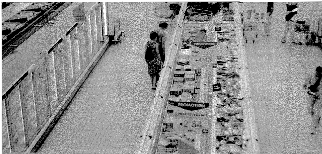
L'ordonnance a pour but de renforcer l'obligation de commercialiser des produits sûrs

Le responsable de la mise sur le marché ne peut pas se décharger de cette obligation en soutenant qu'il n'avait pas eu connaissance des risques (art. L.221-3) puisqu'il est chargé du suivi de son produit.