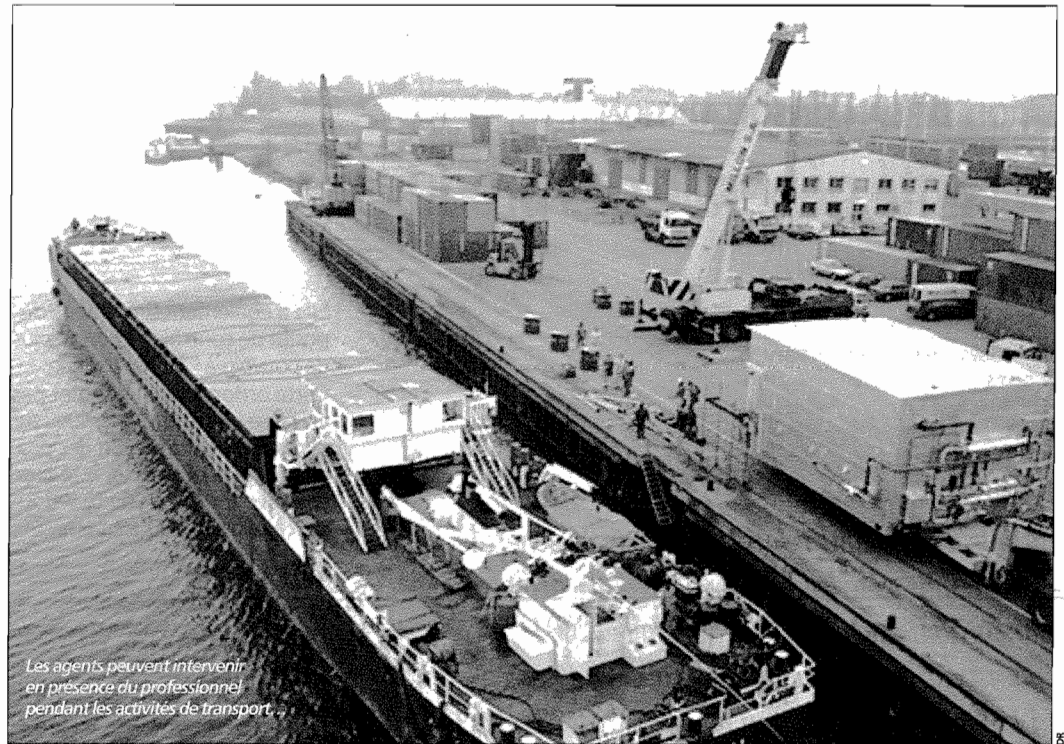
Les agents peuvent intervenir en présence du professionnel pendant les activités de transport.